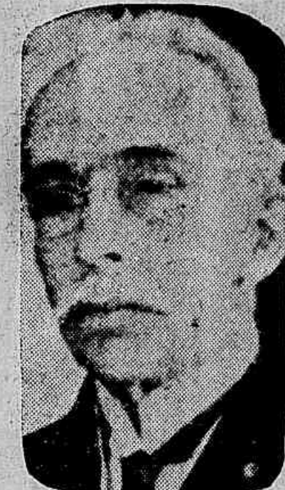
General Lauro Sodré

Os que procuram entroncar na tradição do regimen a acção dos jovens militares na orientação de nossa politica, invocam, com frequencia, os tenentes da Republica Velha.